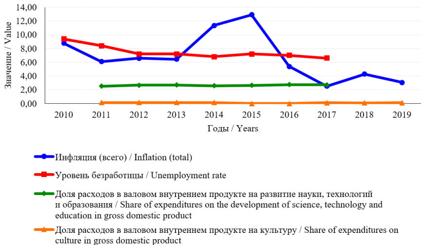
Р и с. 3. Динамика некоторых показателей экономической безопасности России за 2010–2019 гг., %