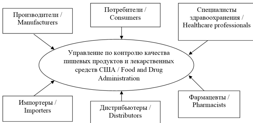
Р и с. 2. Централизованный тип организации системы фармаконадзора на примере функционирования системы фармаконадзора в США

FDA 3500 – форма бланка-извещения о серьезной нежелательной реакции для заполнения специалистами здравоохранения, потребителями, пациентами; FORM FDA 3500A – форма бланка-извещения о нежелательной реакции лекарственного средства для заполнения держателями регистрационных удостоверений (фармацевтическими компаниями), дистрибьютерами, импортерами фармацевтической продукции; FORM FDA 3500B – специальная форма бланка-извещения для потребителей, содержащая инструкцию по заполнению. Такое разнообразие форм отчетности способствует получению информации о нежелательных реакциях лекарственных средств в соответствии с практическими знаниями и навыками, характерными для каждой категории лиц – участников системы фармаконадзора. Случаями, требующими заполнения представленных выше форм, являются развитие непредвиденных нежелательных реакций, отсутствие эффективности при применении лекарственных препаратов, медицинские и врачебные ошибки, а также снижение эффекта при переходе с одного генерического препарата на другой 7 . Схема функционирования системы фармаконадзора в сфере обращения лекарственных средств представлена на рисунке 2.