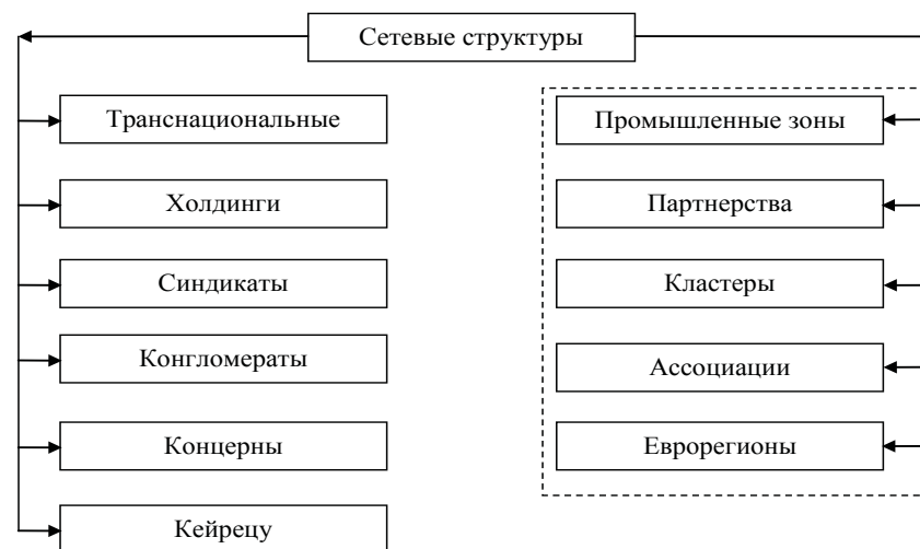
Рисунок. Сетевые структуры, представленные в регионе (пунктиром выделены сетевые структуры, входящие в систему регионального управления)

вания сетевых структур, которые в системе регионального управления представляют собой организационные структуры, где возникает двойная подчиненность и межуровневое взаимодействие, причем одни и те же субъекты могут играть роль управляющих органов, вступать в сетевое взаимодействие для решения хозяйственных и социальных задач отдельного региона. Сетевые структуры (промышленные зоны и парки, партнерства, кластеры, ассоциации) можно отнести к системе регионального управления по наличию региональных отделений, представительств, филиалов; по участию (членству) представителей местных органов власти в большинстве этих структур; по ограниченности отдельной четко определенной территорией и т. д.