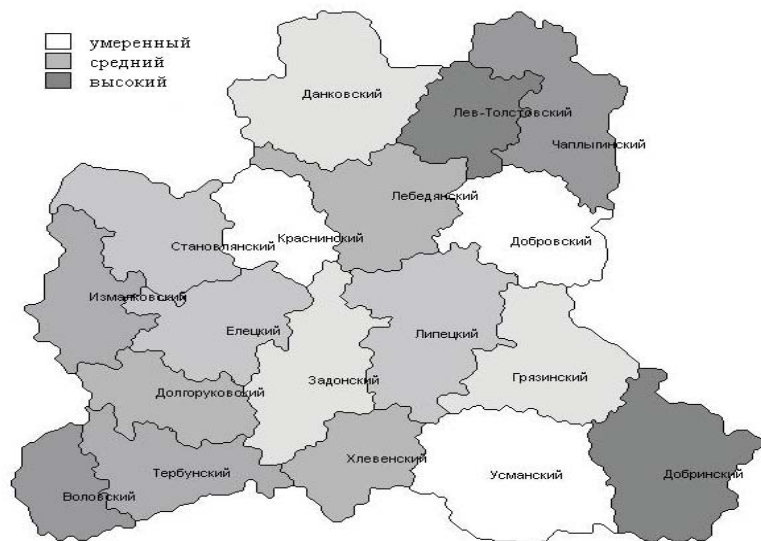
Рис. 1. Уровень социально-экономического развития фоновой формы организации пространства в Липецкой области

Три северных района (Данковский, Лев-Толстовский и Чаплыгинский) отличаются умеренным уровнем внутри «коридора развития» и высоким уровнем вне его. Восточные районы (Лебединский, Добровский, Липецкий, Грязинский) имеют средний уровень развития по всей территории, южные районы (Добринский, Усманский, Хлевенский, Задонский, Елецкий, Воловский) — высокий. Западные районы (Краснинский, Становлянский, Измалковский, Долгоруковский, Тербунский) характеризуются высоким уровнем внутри «коридора развития» и умеренным уровнем за его пределами.