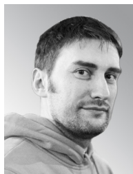
А. В. Невский 1