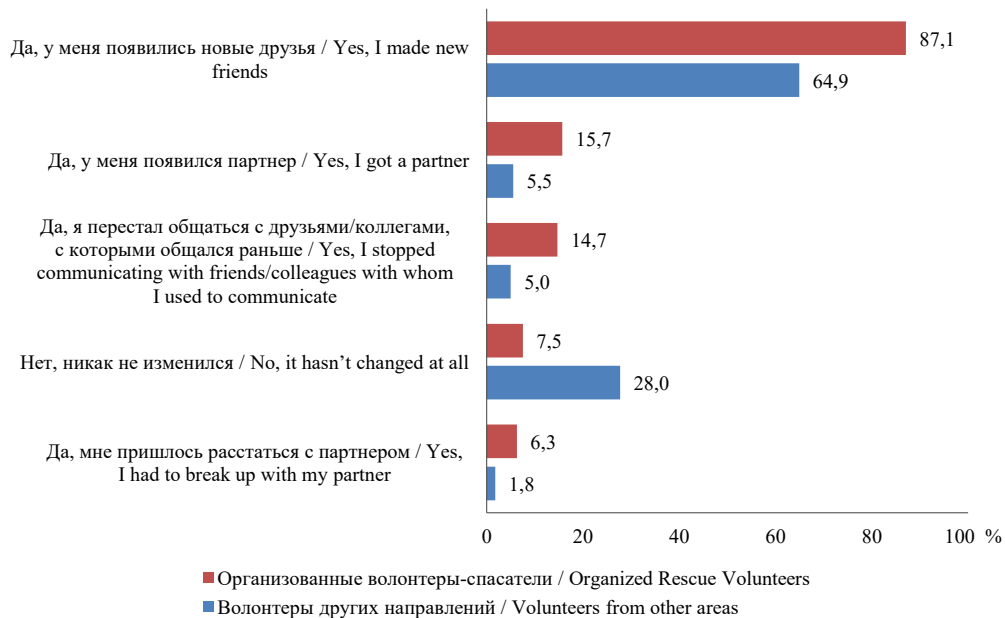
Р и с. 3. Изменение круга общения волонтеров, % от числа выборов F i g. 3. Change in volunteers' social circle, % of elections number

Организационная вовлеченность подтверждается также переменами в структуре социальных связей, которые выражаются в изменении круга общения с момента вступления в волонтерство. Для волонтеров в сфере спасательной работы изменения круга общения по сравнению с волонтерством в других направлениях более заметны (рис. 3).