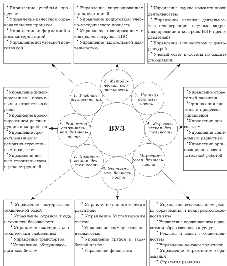
Рис. 1. Концептуальная схема управления по макроподсистемам деятельности вуза

Руководители высшего и среднего звена управления вуза обычно неохотно отвлекаются на решение стратегических задач. Все свое рабочее время они тратят на оперативные вопросы, от которых зависят ближайшие результаты их деятельности и соответствующее поощрение.