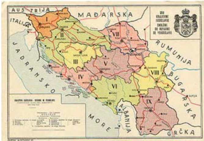
Рис. 3. Бановины Королевства Югославия 1931—1939 гг.

Разделением страны на бановины был реализован план словенца Б. Вошняка от 1917 г., согласно которому (в одном из набросков конституции) государство предлагалось разделить от десяти до двенадцати жупаний 14 , которые носили бы, по французской модели, имена больших рек 15 .