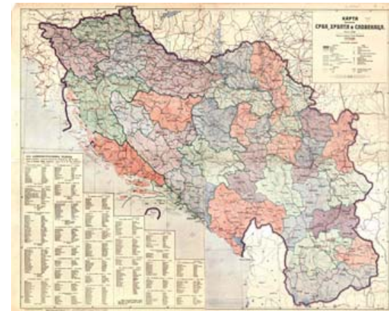
Рис. 2. Территориальное разделение Королевства сербов, хорватов, словенцев (СХС) на области 1921—1929 гг.

Принятие конституции проходило трудно, так как противодействие оппозиции было очень сильным. Предварительно были проведены выборы в Учредительное собрание (28 ноября 1920 г.), но настоящего выбора государственного строя не произошло: монархия была навязана еще до провозглашения конституции. Поэтому Хорватская крестьянская республиканская партия, борющаяся за конфедеративный строй, в котором сохранилась бы «континуальность хорватской государственности», со своими 50 депутатами не участвовала в сессии парламента. Они не признавали объединение от 1 декабря 1918 г. К ним присоединились коммунисты (58 депутатов), не голосовавшие за конституцию, поскольку придерживались мнения, что новое государство является «искусственным версальским построением», которое надо разрушить 7 .