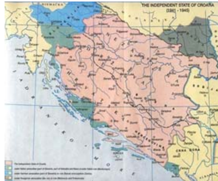
Рис. 5. Независимое государство Хорватия 1941—1945 гг.

состав был значительно ослаблен дезертирством хорватских офицеров и солдат. Они переезжали в Хорватию, так как там уже 10 апреля было создано Независимое Государство Хорватия (НГХ, или на сербском НДХ, рис. 5), ставшее германским и итальянским союзником. Это было прологом к одной из самых трагических страниц не только Второй мировой войны — в концлагерях в НГХ, созданных сразу после провозглашения НГХ (Ясеновац, Ядовно, Старая Градишка и др.), страдали многие люди, особенно сербы, евреи и цыгане. Точное число погибших никогда не было официально обнародовано (по разным оценкам, в результате геноцида погибло от 197 до 800 тыс. сербов), возможно, и потому, что после войны хорваты новыми властями были переведены в ряды победителей в войне.