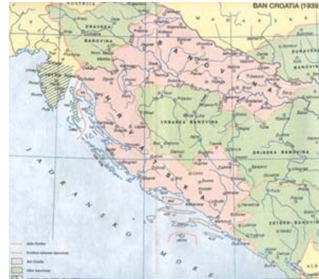
Рис. 4. Хорватская бановина 1939 г.

в югославской экономике 17 . Вскоре произошло разделение национальной элиты на два противоборствующих лагеря — с одной стороны Англия и Франция, с другой — Германия.