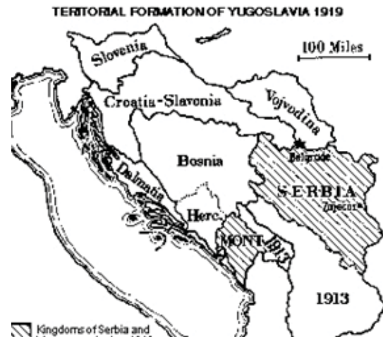
Рис. 1. Формирование Югославии из исторических провинций в 1919 г. 5

В ранних документах устройство будущего государства не было определено, но в них преобладало негативное отношение к федеративному устройству 2 . В начале 1920-х гг., когда готовилась первая (Видовданская) конституция, еще преобладало убеждение, что централизм является единственным способом, позволяющим обеспечить народное и государственное единство. Отсюда и стремление к разделению исторических провинций, которые вошли в Югославию 3 , чтобы таким путем сделать невозможным возникновение сепаратистских тенденций, основанных на их особенностях 4 . В соответствии с этим территория государства была разделена на меньшие единицы: округа, уезды и общины.