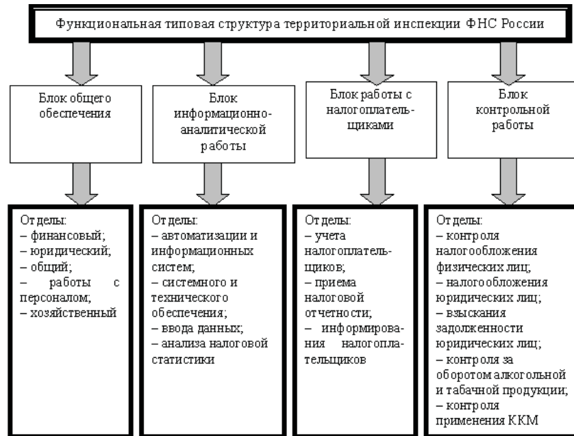
Рисунок. Унифицированная структура территориальной инспекции ФНС России по Республике Мордовия

вания задолженности и обеспечения процедуры банкротства; аналитический отдел; отдел контрольной работы; правовой отдел; отдел обеспечения; отдел кадров и безопасности; отдел работы с налогоплательщиками; отдел информатизации.